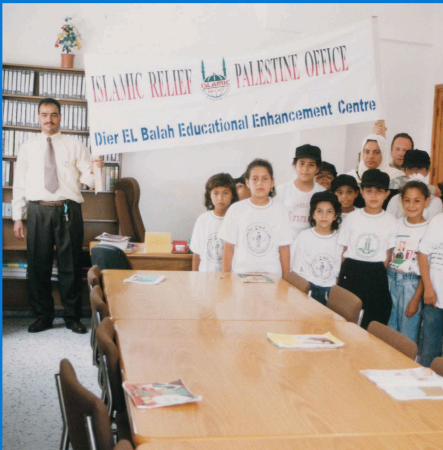
Islamic Relief-ansatte sammen med barn som går på Deir El Balah Educational Enhancement Centre

«For oss var senteret det tredje hjemmet etter vårt egentlige hjem og skolen. Vi deltok i Kanaan-parlamentet for barn, der vi diskuterte mange problemer som barn står overfor, og kom med forslag til passende løsninger. Vi har jobbet hardt med å utgi hefter der vi prøver å opplyse barn og fortelle dem om deres rettigheter og plikter. Jeg har hatt stor glede av lekebiblioteket, som inneholder ulike spill, leker og videobånd med undervisning og underholdning. Jeg har også lært å bruke en datamaskin.»