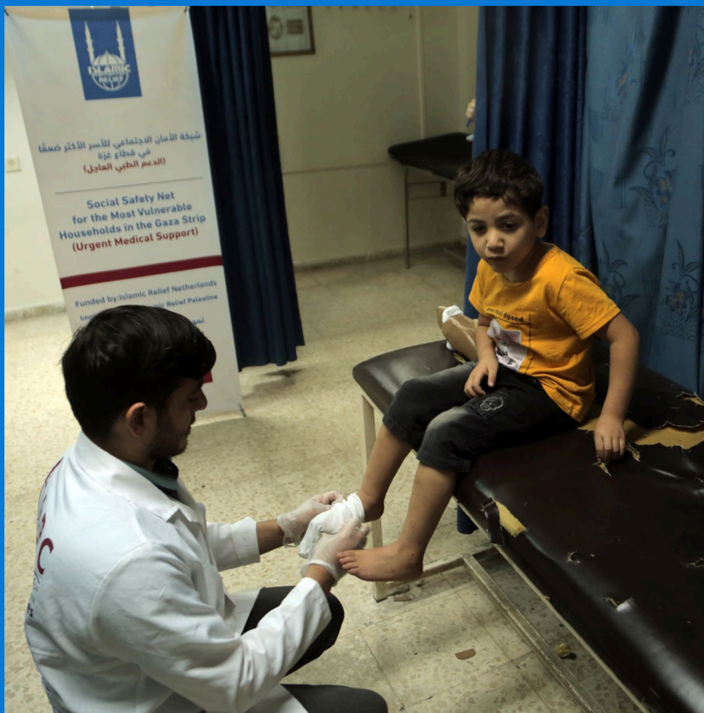
En lege undersøker et barn som en del av et helseprosjekt i regi av Islamic Relief, som har nådd ut til over 30 000 barn i Gaza.

Prosjektet har hjulpet over 30 000 barn som Janaa til å trives på skolen og hjemme, i tillegg til å bedre selvfølelsen og den psykiske velferden deres.