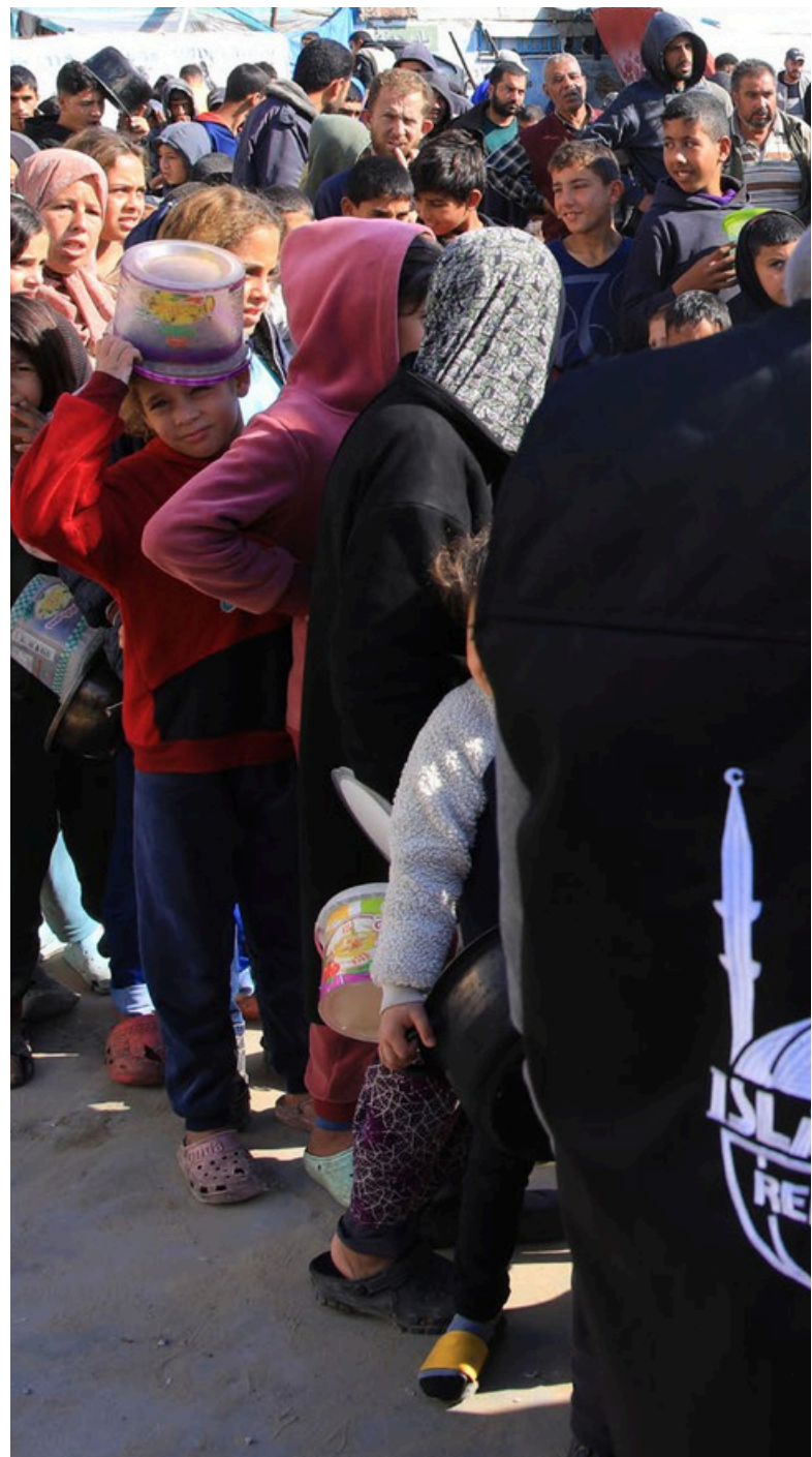
Middle area, januar 2025 – Familier står i kø for en utdeling av Islamic Relief

Internasjonale myndigheter må ikke være medskyldige i Israels ulovlige okkupasjon. Vi vil fortsette å oppfordre og presse regjeringer til å avslutte våpensalg og ta andre politiske tiltak for å sikre at Israel overholder internasjonal lov. Fremfor alt må ikke redselen fra de siste 15 månedene glemmes, og det må være rettferdighet og ansvarlighet for de gjentatte bruddene på folkeretten, Israels brutale kollektive avstraffelse av en hel befolkning, og dets fullstendige ignorering av tiltakene beordret av Den internasjonale domstolen for å forhindre folkemord.