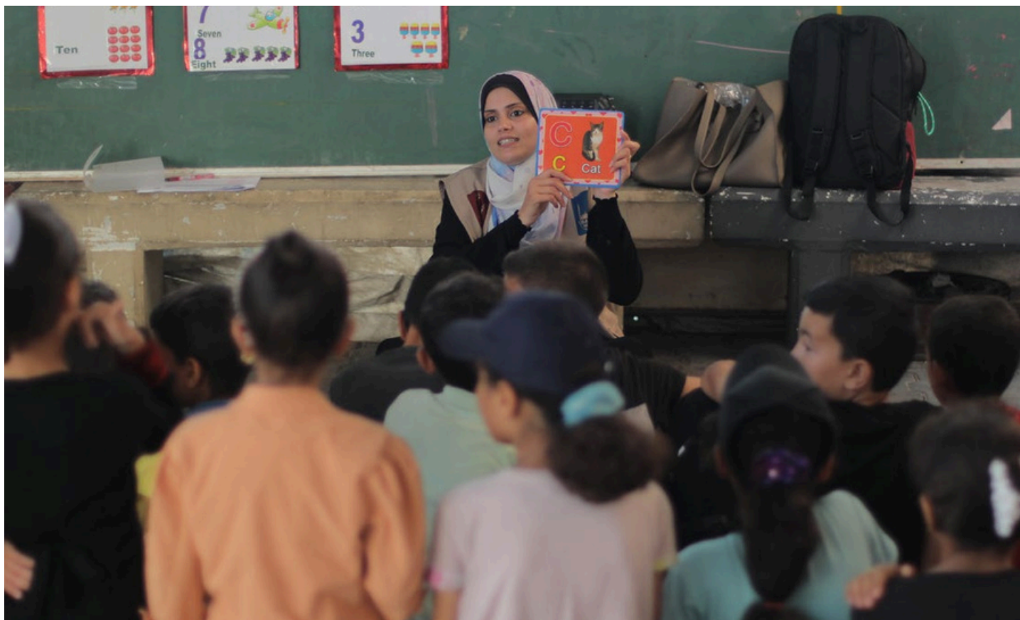
Utdanning er den grunnleggende byggesteinen for en lysere fremtid, og Islamic Relief planlegger å støtte barn tilbake til formell utdanning

Vi har også hevet standarden på undervisning og omsorg for førskolebarn ved å innrede barnehagene og hjelpe dem med å innføre en ny læreplan. I 2018 sørget vi for opplæring og veiledning av lærere og oppdaterte læringsressurser ved hjelp av smarte enheter for å støtte den kognitive, sosiale, emosjonelle og pedagogiske utviklingen til 8 400 barn.