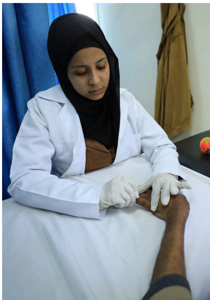
En helsearbeider undersøker en pasient

I 2012, som en del av vår nødhjelp i forbindelse med en ny runde med konflikt, mobiliserte vi raskt for å levere medisinsk utstyr til en verdi av 1 million pund til sykehusene, slik at de kunne behandle skadde som kom inn. I 2020 etablerte vi et prosjekt for å diagnostisere helseproblemer hos barn og tilby livsforandrende behandling og rehabiliteringstjenester. Dette prosjektet bidro til at over 30 000 barn fikk det bedre på skolen og hjemme, og at de fikk bedre selvtillit og psykologisk velvære.