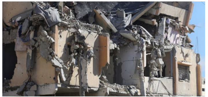
Om lag 69 prosent av Gazas bygninger er jevnet med jorden eller skadet