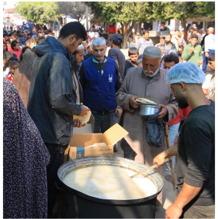
Islamic Relief deler ut varme måltider til fordrevne palestinere i Gaza

Islamic Reliefs team og lokale partnere har oppholdt seg i Gaza siden opptrappingen startet. I løpet av de siste 500 dagene har vi fokusert på å yte nødhjelp der det har vært mulig, slik vi har gjort under hver eneste eskalering siden vi begynte å arbeide i Gaza i 1997.