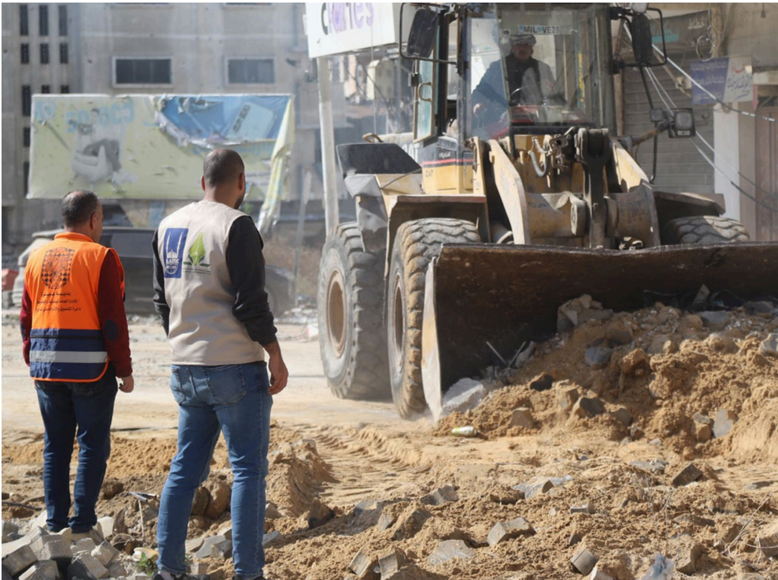
Islamic Relief var blant de første humanitære organisasjonene som begynte å rydde ruinene da våpenhvilen ble kunngjort i januar 2025