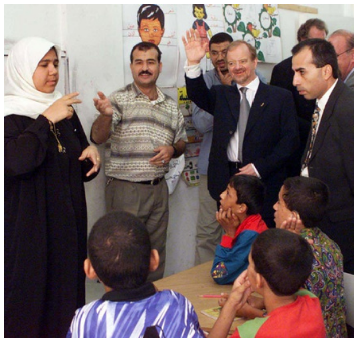
Storbritannias daværende utenriksminister Robin Cook deltar på åpningsseremonien for et utdanningscenter som Islamic Relief har opprettet i Deir El Balal-leiren i 1998.

I 2017 bidro vi til å forbedre helsetjenestene for barn ved to spesialskoler i Gaza, ved å installere behandlingsapparater i fysioterapirom, innrede klasserom og biblioteker og skaffe til veie utstyr og spill for å hjelpe barn med funksjonsnedsettelse.