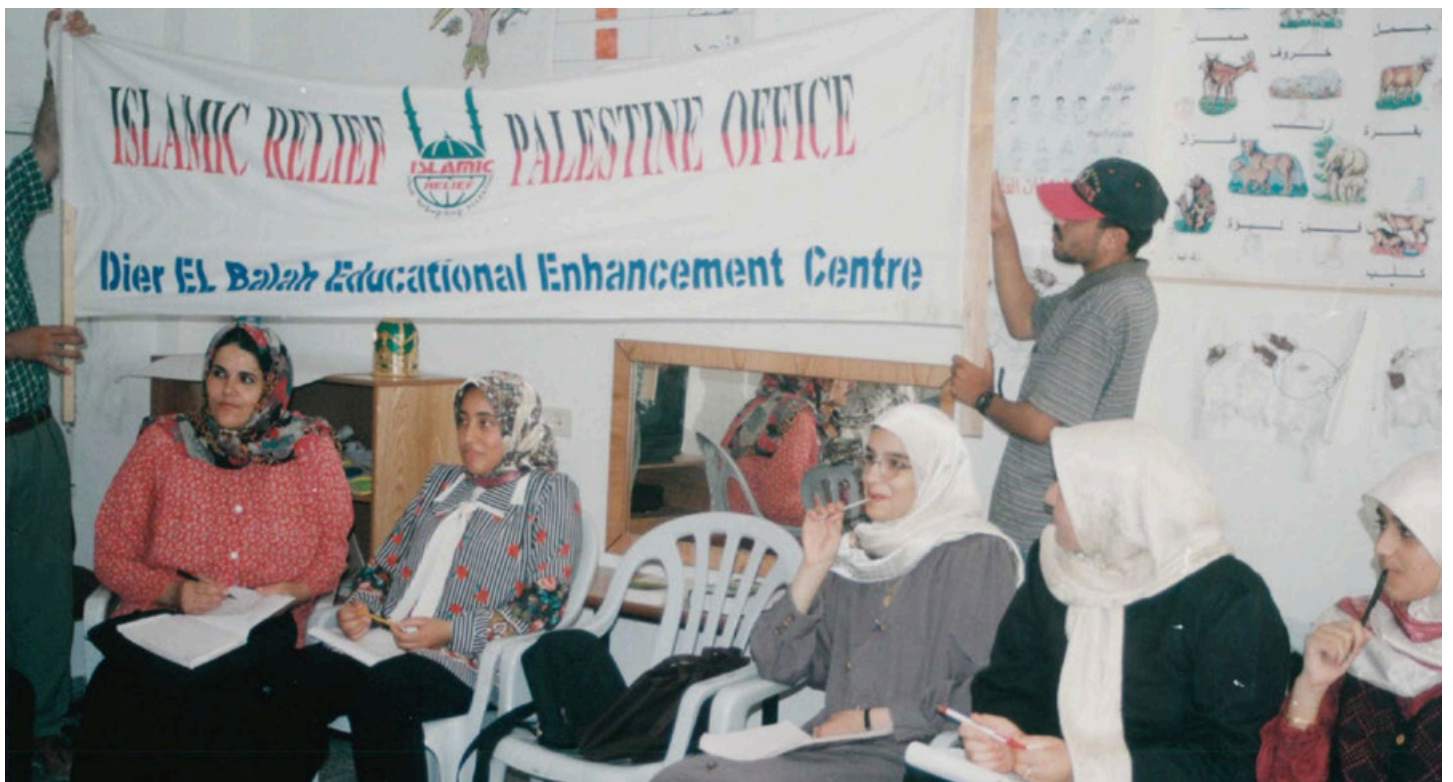
Islamic Relief har støttet sårbare mennesker i Palestina i nesten 30 år

Islamic Relief arbeider for å lindre det palestinske folkets utålelige lidelser og nå ut til de mest sårbare for å forhindre ytterligere dødsfall. Vi vil trappe opp nødhjelpsinnsetningen vår for å øke beskyttelsen for de som er hardest rammet, og når tiden er inne, vil vi hjelpe til med å reparere, gjenoppbygge og styrke viktige tjenester, fasiliteter og infrastruktur. Vi håper å kunne bidra til å få barn tilbake på skolen, få sykehus og spesialiserte omsorgssentre i gang igjen og gjennomføre andre langsiktige utviklingsprogrammer som gjør lokalsamfunnene i stand til å gjenoppbygge selvhjulpenhet på en bærekraftig måte. Vi vil fortsette å kjempe for å få slutt på Israels ulovlige okkupasjon av Palestina, slik at det kan bli varig fred.